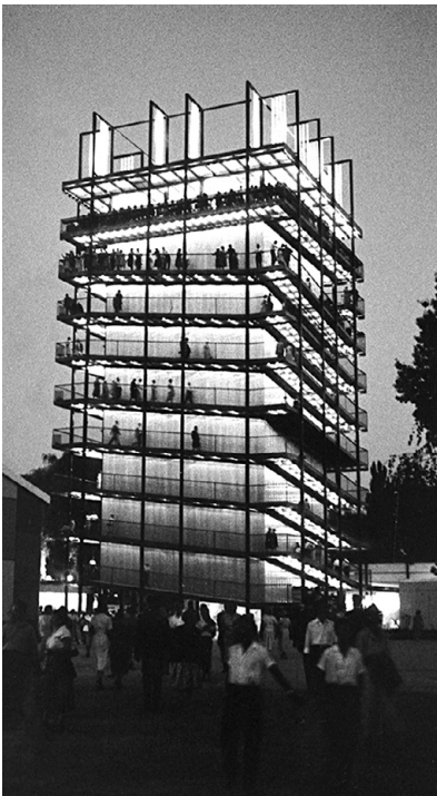
Saffa 1958. Turm bei Nacht. (Archiv Annemarie Hubacher, Zürich)

Die Architektinnen setzten den ideologischen Diskurs der Organisatorinnen formal mit Rundhallen um, worin traditionell weiblich konnotierte Arbeiten wie Erziehen, Ernähren, Kleiden, Pflegen und Verführen ausgestellt waren. In Anlehnung an die Verknüpfung von Form und Ideologie, wie sie die Landi 39 geprägt hatte, drückte sich auch die Saffa 58 durch eine von Geschlechterstereotypen bestimmte formale und symbolische Sprache aus. Im Gegensatz dazu erschien der Turm jedoch als starkes emanzipatorisches Manifest: Hoch aufrecht, mutig und kalt, war er von der meist starren Symbolik und Ideologie der Saffa 58 befreit und widerlegte jede biologisierende Interpretation von Architektur, im Sinne von: Knaben bauen Türme, Mädchen richten Innenräume ein. Mit Stahl und Beton widersetzte sich der Turm der Ästhetik des Intimen und Weiblichen.